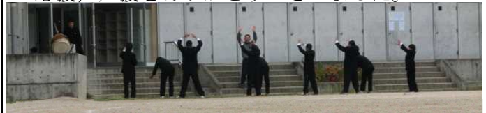
体育館前でエールの練習をする応援団