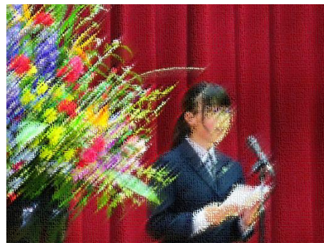
【在校生歓迎の言葉】