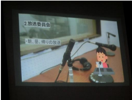
【スライドでの生徒会活動の説明】

4月11日（火）に対面式を行いました。スライドを使った学校生活についての説明や先生方紹介、実演を交えての部活動紹介など、生徒会の執行部が中心となって工夫を凝らした説明を行いました。最後は、これからの中学校生活を頑張れるようにとの願いを込め、応援団からエールを送りました。