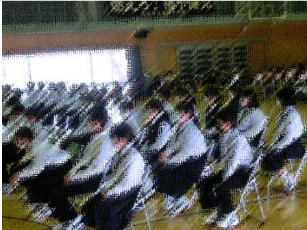
【真剣に見ている新入生】