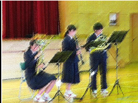
【部活動紹介（吹奏楽部）】