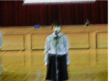
【新入生代表のお礼の言葉】

入学式では、新入生代表として■■■■さんが「福岡中学校の生徒としての誇りをもって充実した学校生活を送りたい」、対面式では■■■■さんが「立派な福中生の一員になれるよう努力したい」と述べていました。