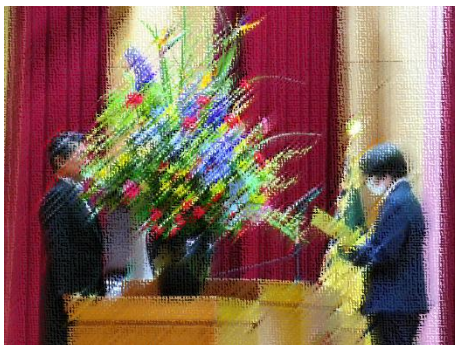
【新入生代表の言葉】